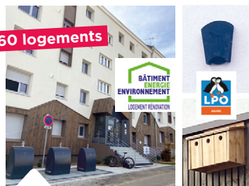
60 logements Résidence La Ballue à Angers

Quand Podeliha réhabilite son patrimoine, c'est avec un objectif : la performance énergétique. L'entreprise vise les labels environnementaux les plus exigeants dans ses opérations, tout en diminuant drastiquement les consommations d'énergie et donc, les émissions.