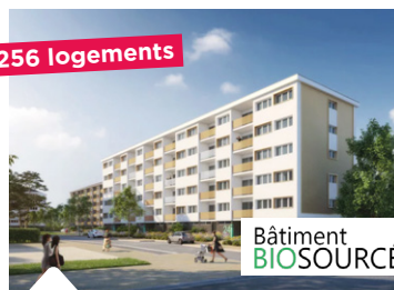
256 logements Résidence Gabriel Baron à Angers