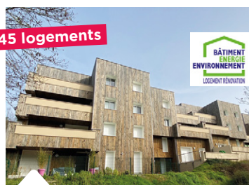
45 logements Résidence Elsa Triolet au Mans